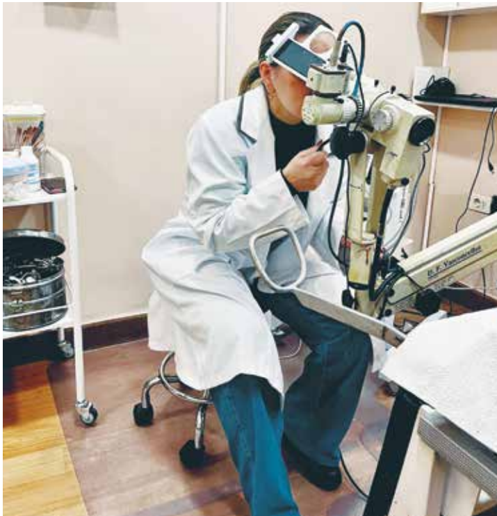
Figura 2.1 Bancos con ruedas.

El equipamiento fundamental para el consultorio de esta especialidad es el colposcopio (Figura 2.2). La elección de dicho instrumental no es un tema menor, ya que corresponde al insumo más importante. Los hay de pie, con barral telescópico vertical y móviles de pared; existe una opción intermedia que consiste en aparatos con brazo lateral articulado.