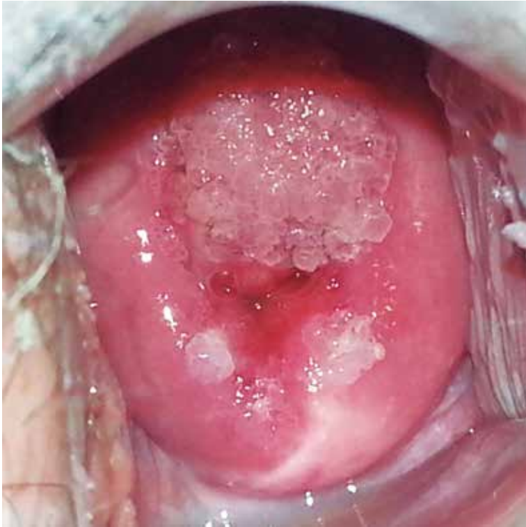
Figura 8.3 Condilomas espiculados.