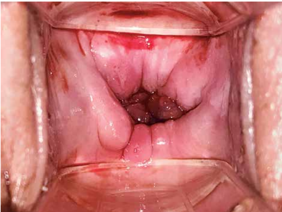
Figura 10.21 Visualización de posoperatorio de traquelectomía radical.