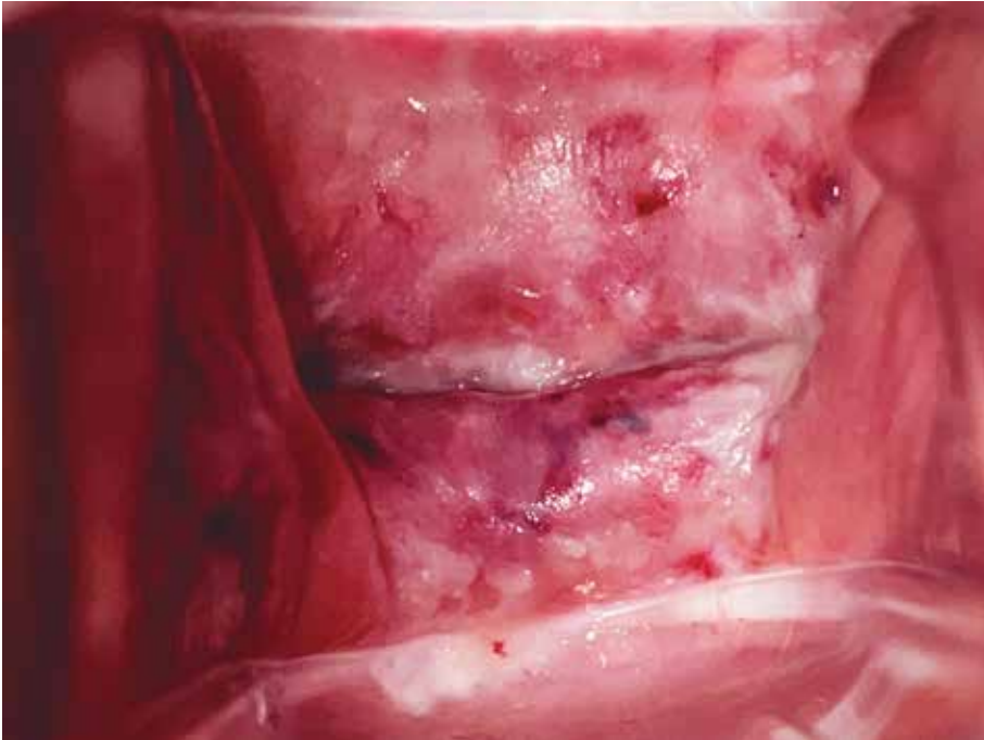
Figura 10.20 Recidiva en cúpula vaginal como VAIN.