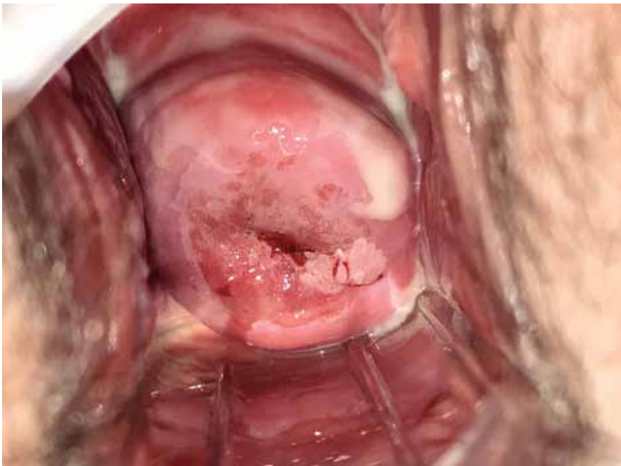
Figura 8.4 Condiloma velloso.